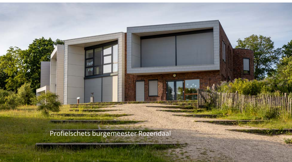
Profielschets burgemeester Rozendaal